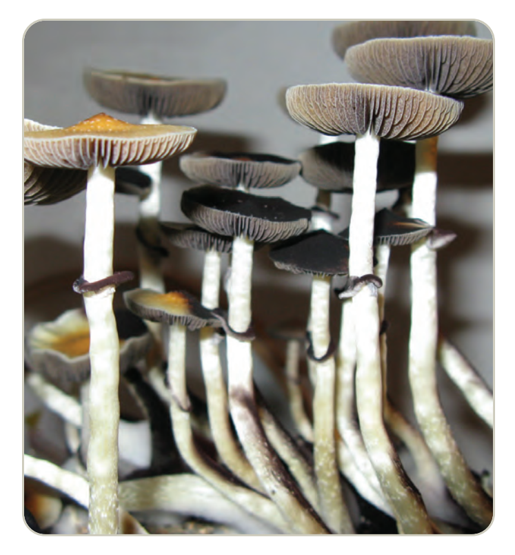
Setas de psilocibina

Náuseas, vómito, debilidad muscular y falta de coordinación