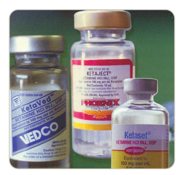
Frascos con ketamina líquida

La ketamina, junto con otras "drogas de club" se ha vuelto popular entre los adolescentes y adultos jóvenes en los centros nocturnos y raves. Es producida de manera comercial en forma de polvo o líquida. La