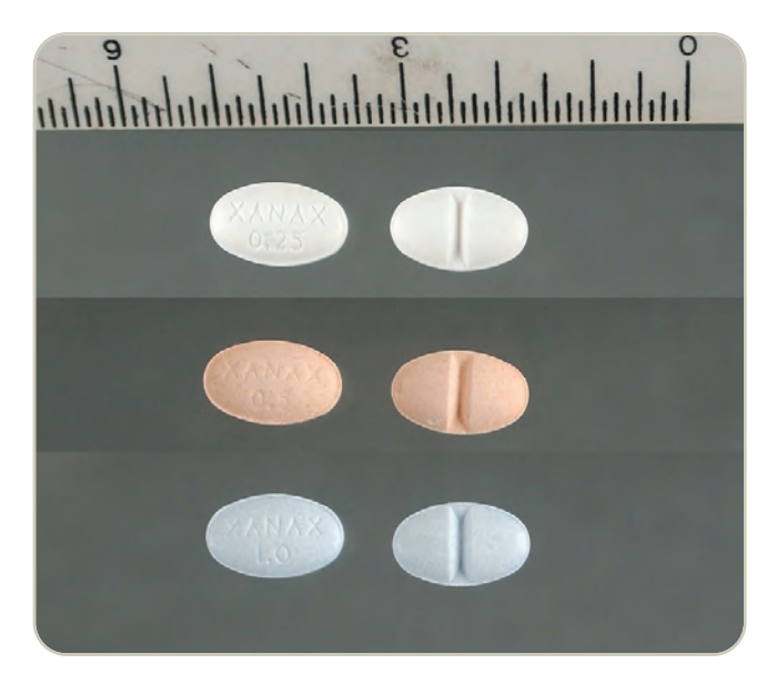
Comprimidos ranurados de Xanax 0.25,0.5 y 1 mg

Generalmente, los productos farmacéuticos legítimos son desviados al mercado ilegal. Los adolescentes pueden obtener depresores del botiquín de casa, o a través de familiares, amigos, internet, doctores y hospitales.