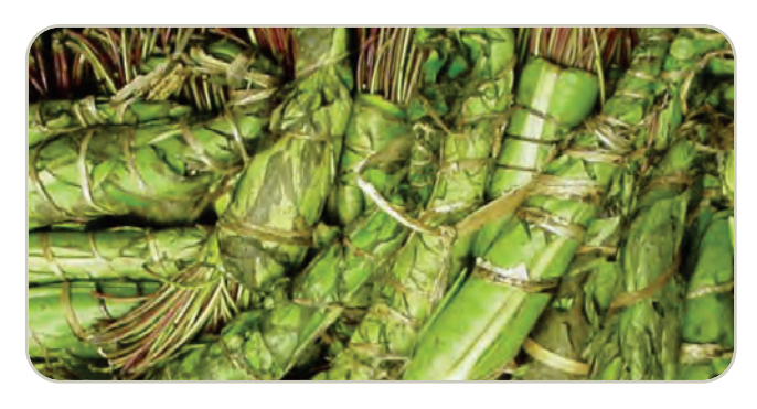
Planta de Khat

Generalmente se mastica como tabaco, se retiene en la mejilla y se mastica en forma intermitente para liberar la droga activa, que produce un efecto