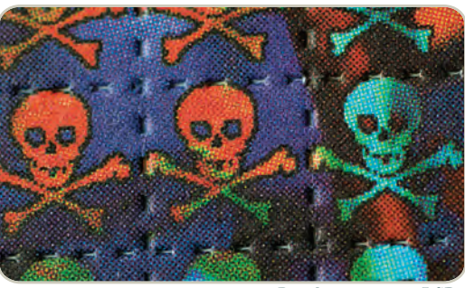
Papel secante para LSD

Durante la primera hora después de su ingestión, los consumidores pueden experimentar cambios visuales con cambios extremos en el estado de ánimo. Mientras duran las alucinaciones el consumidor puede sufrir alteraciones en la percepción de la profundidad y el tiempo, acompañadas por una percepción distorsionada de la forma y el tamaño de los objetos, los movimientos, colores, sonidos, el tacto y la imagen corporal de sí mismo.