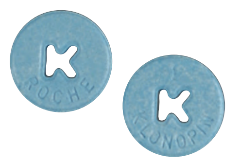
Comprimidos de Klonopin 5 mg

La mayoría de los depresores son sustancias controladas comprendidas en las Clasificaciones I, II, III o IV de la Ley de Sustancias Controladas, dependiendo del riesgo de abuso y de su uso médico aceptado actualmente. Muchos tienen usos médicos aprobados por la FDA. En los Estados Unidos, el Rohypnol® y el Quaaludes® no se fabrican ni se comercializan legalmente, y no tienen un uso médico aceptado en los Estados Unidos.