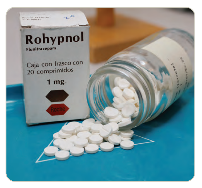
Comprimidos de Rohypnol®

El Rohypnol también se usa indebidamente para incapacitar física y psicológicamente a las víctimas