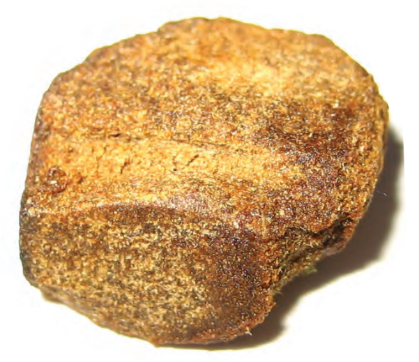
Concentrado de marihuana

Hay muchos métodos para convertir o "manufacturar" la marihuana en concentrados. Uno es el proceso de extracción con gas butano. Este proceso es particularmente peligroso porque utiliza gas butano para extraer el THC de la planta de cannabis, y dado que se trata de un gas altamente inflamable, el proceso ha resultado en violentas explosiones. Se han reportado laboratorios de extracción de THC en todo el país,