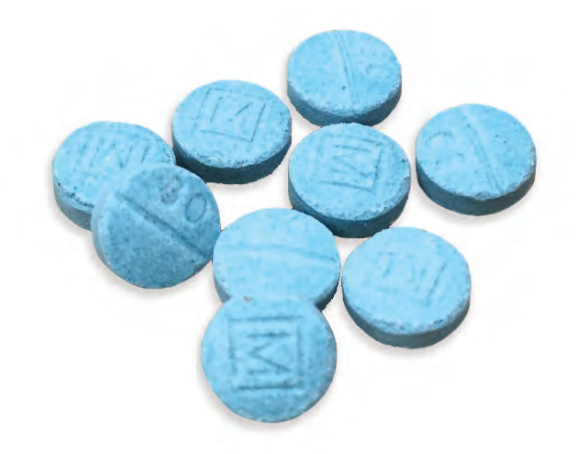
Tabletas de oxicodona falsificadas producidas clandestinamente que contienen fentanilo.

¿Cómo se abusa de los opioides sintéticos? El abuso de opioides sintéticos de producción