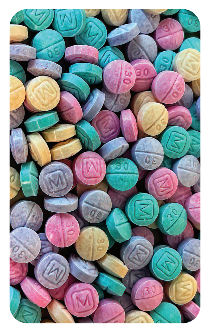
Pastillas falsas de oxicodona M30 que contienen fentanilo

El fentanilo es un narcótico de la Clasificación Il bajo la Ley de Sustancias Controladas de los Estados Unidos de 1970.