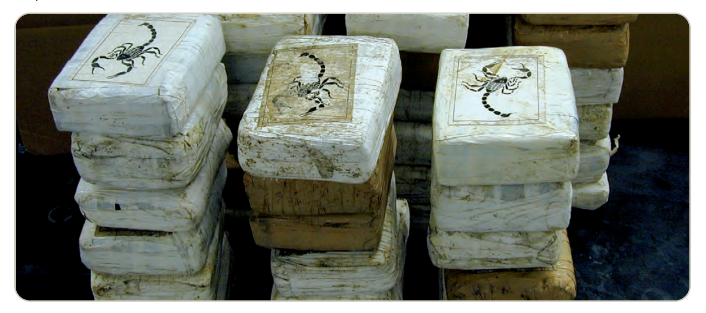
Ladrillos de cocaína, incautados por la DEA

La cocaína es una droga de Clasificación II bajo la Ley de Sustancias Controladas, lo que significa que tiene un alto potencial de abuso y un uso médico aceptado en la actualidad en los Estados Unidos. La solución de clorhidrato de cocaína (4 por ciento y 10 por ciento) se usa principalmente como anestésico local del tracto respiratorio superior. También se usa para reducir el sangrado de las membranas mucosas de la boca, garganta y cavidades nasales. Sin embargo, actualmente se han desarrollado productos más efectivos para estos propósitos, por lo que el uso médico de la cocaína en los Estados Unidos es raro.