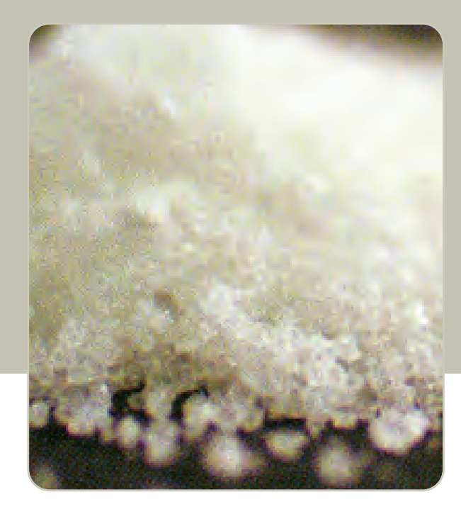
Sales de Baño

Las catinonas sintéticas se fabrican en Asia Oriental y han sido distribuidas a niveles mayoristas en Europa, Norte América, Australia y otras partes del mundo.