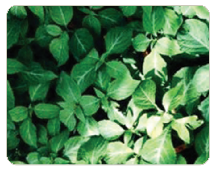
Hojas de la planta Salvia divinorum

La planta tiene hojas verdes en forma de espada similares a las de la menta. Las plantas pueden alcanzar más de un metro de altura, tener grandes hojas verdes, tallos huecos cuadrados y flores blancas con cálices púrpuras.