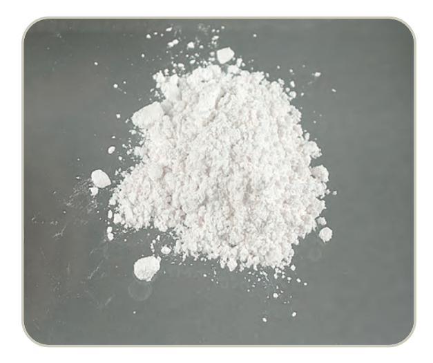
Heroína en polvo blanco