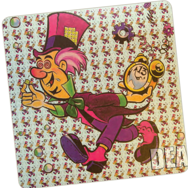
Papel secante con LSD