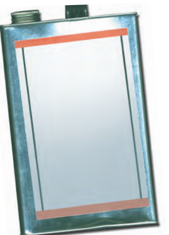
Disolvente de pintura

Los productos domésticos comunes como pegamento, líquido para encendedores, líquidos de limpieza y pintura producen vapores químicos que pueden inhalarse.