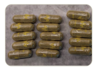
Cápsulas de kratom