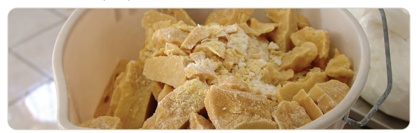
Metanfetamina en forma elaborada

La metanfetamina es un estimulante de Clasificación II, bajo la Ley de Sustancias Controladas, lo que significa que tiene un alto potencial de abuso y un uso médico actualmente aceptable (en productos aprobados por la FDA). Está disponible solo con receta médica que no puede volver a surtirse. Actualmente, hay solo un producto legal que contiene metanfetamina, el Desoxyn®. Se comercializa en tabletas de 5, 10 y 15 miligramos ( formulaciones de liberación inmediata y liberación prolongada) y tiene un uso muy limitado en el tratamiento de la obesidad y el TDAH.