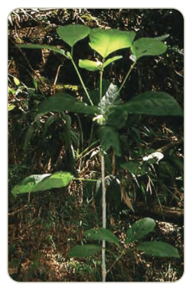
Árbol de kratom

El kratom no está regulado por la Ley de Sustancias Controladas; sin embargo, puede haber algunas regulaciones o prohibiciones estatales en contra de la posesión y el uso de kratom. La FDA no ha aprobado el kratom para uso médico. Además, la DEA puso al kratom como una droga y químico preocupante.