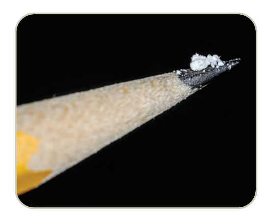
Una dosis letal de fentanilo

Desde 2011 hasta 2018, tanto las sobredosis fatales asociadas con el abuso de fentanilo y los análogos del fentanilo producidos clandestinamente, como los hallazgos policiales aumentaron notablemente. Según los Centros para el Control y la Prevención de Enfermedades (CDC), tanto en 2011 como en 2012, los análogos del fentanilo estuvieron involucrados en aproximadamente 2.600 muertes por sobredosis de drogas, pero desde 2012 hasta 2018, el número de muertes por sobredosis de drogas con fentanilo y otros opioides sintéticos aumentó dramáticamente cada año. Más recientemente, se ha producido un resurgimiento del tráfico, la distribución y el abuso de fentanilo y análogos de fentanilo producidos ilícitamente con un aumento dramático asociado de muertes por sobredosis que oscilan entre 2.666 en 2011 y 31.335 en 2018.