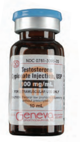
Inyección de cipionato de testosterona, USP