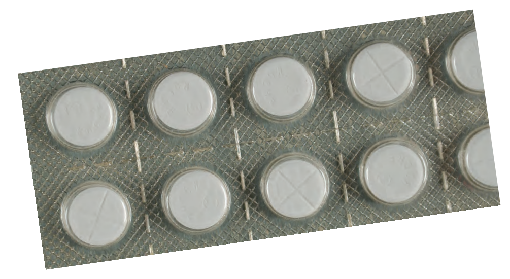
Blíster de comprimidos de Rohypnol®

El Rohypnol® es una sustancia de Clasificación IV bajo la Ley de Sustancias Controladas. La fabricación, venta, uso o importación a los Estados Unidos de Rohypnol® no está aprobada. Sin embargo, en otros países se fabrica y se comercializa legalmente. Las sanciones por posesión, tráfico y distribución que involucran un gramo o más son las mismas que las de las drogas de Clasificación I.